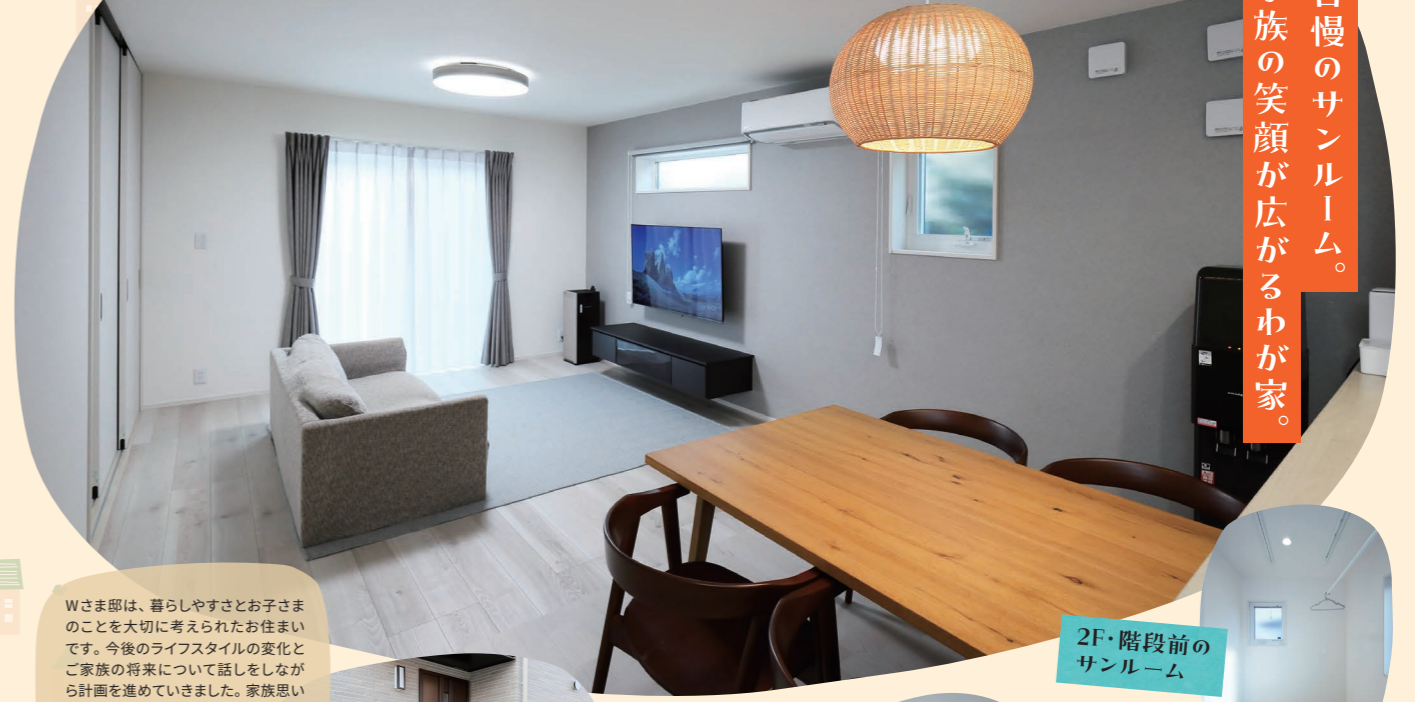
2F・階段前のサンルーム

サンルームはあえて壁や区切りを付けずに、階段ホールを兼ねた形にしました。おかげで階段下や廊下が明るく、どの部屋も風通しのよい空間になりました！