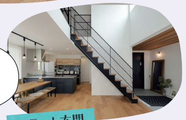
フラット玄関 & 吹き抜け

自慢のロックガーデン！内観はスケルトン階段の黒いアイアンと木目に合わせて、インテリアを統一しました！