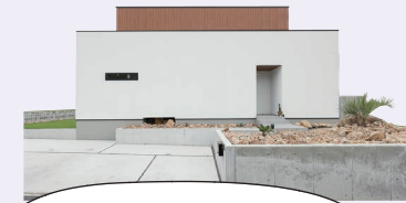
広い庭、キューブ型の建物、吹き抜けとスムーズな回遊動線がマストでした。見た目にもこだわりましたが、暮らしてみると機能性も伴っていて安心しました。

Kさま邸は見晴らしのいい開けた土地に建つ、キューブリック&モダンな一邸。広い前庭にはカリフォルニアなど、アメリカ南西部を思い起こさせるパームツリーや岩が点在、屋内の坪庭にも大きな岩がオブジェのように飾られている。段差のないフラット玄関から続く二・三・五帖のLDKは、吹き抜けや坪庭の効果もあって開放感は格別。「キッチンで料理しながら、外の景色も見えるようにしたかった」という奥さまのリクエスト通り、キッチンカウンター正面にある縦長のF1X窓からは、少し先にある森が見えるように設計。家の中に居ながらにして自然が感じられる、明るく広々、開放感たっぷりの個性的な家が完成した。