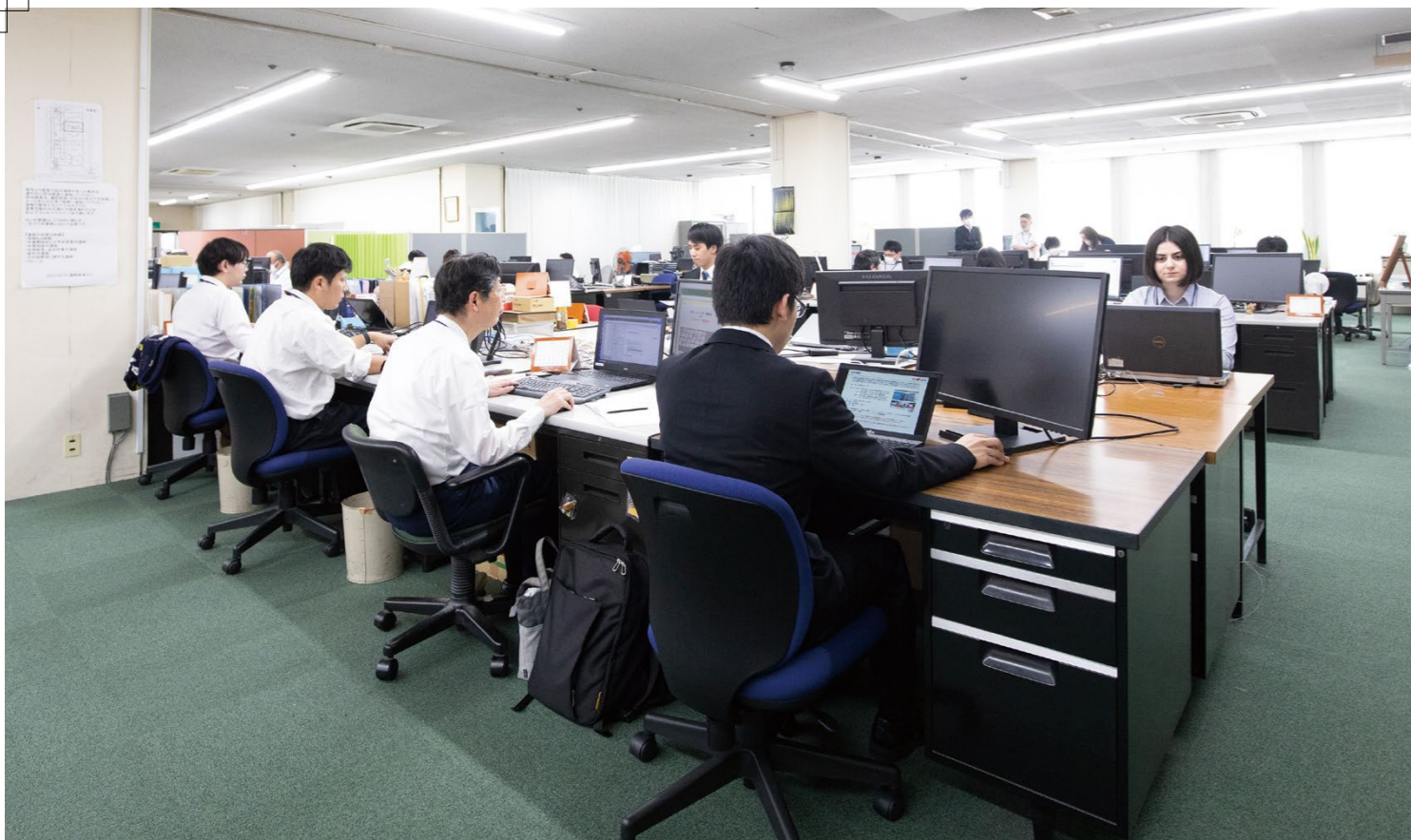
宇野港を望むビル4階にあるワンフロアのオフィス。約50名のシステムエンジニアが、日々切磋琢磨しながら業務にあたっている

今年設立50周年を迎える「株式会社NICS」は、「地域のリーディング企業に」という経営目標を掲げ、ソフトウェアの受託開発を軸にしたITサービスを提供。なかでも、開発に40年以上携わる港湾物流システムは、業界トップレベルの知識・技術を有することから、国内の主要な港で導入されている。また、AI技術といった特定の分野に関しては、社内に専門のプロジェクトチームを設け、情報収集や開発・研究を積極的に行っている。「当社では人間にしかできない業務とAIに任せる業務を見極めつつ、ソフトウェアの開発・設計を効率よく行い、お客さまの要望に的確に答える商品サービス