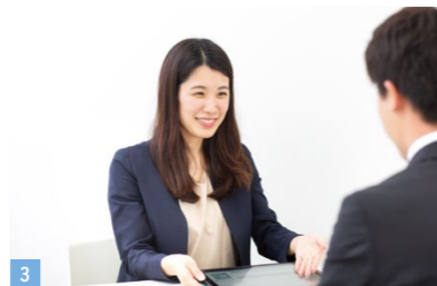
1 顧客との話の進め方など、チームの先輩がやさしくアドバイスしてくれる 2 営業は個人の裁量が大きいため、活動時間や業務量を調整しやすい 3 育休から復帰後も、キャリアを落とすことなく仕事を継続できる