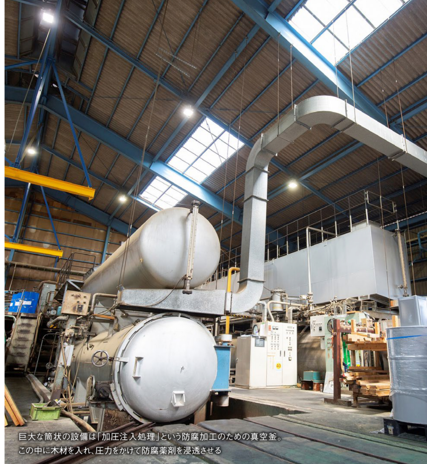
巨大な筒状の設備は「加圧注入処理」という防腐加工のための真空釜。この中に木材を入れ、圧力をかけて防腐剤を浸透させる