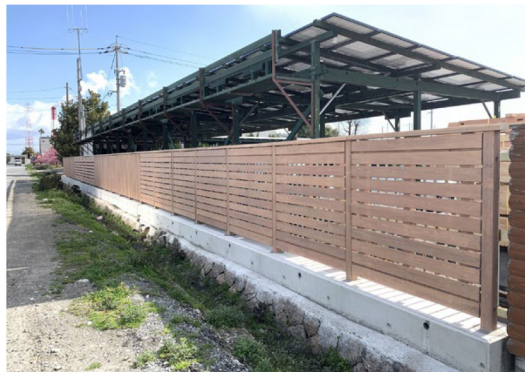
本社工場北側の板塀は3年前に自社で製造・施工したものです。防腐加工された木材の耐久性を実際に見て確かめることができる