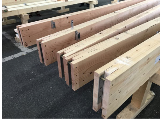
切削加工と金物取付けを終えたプレカット材。設計図面通り正確に加工された構造材が住宅建築の現場に運ばれ、組み立てられる