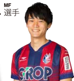
印度カレー子・著 こいしゆうか・まんが サンクチュアリ出版

ルーを使わないおいしいスパイスカレーが、自宅で簡単に作れるようになります。自分もオフのときはカレーを作ってリフレッシュしています。年末年始の時間があるときに、この本を参考にしながら、ぜひ作ってみてください!