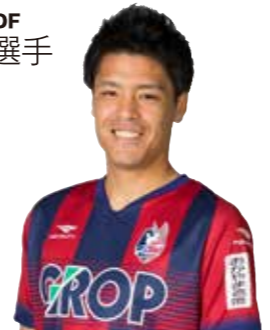
フェラン・ソリアーノ・著 グリーン裕美・訳 アチーブメント出版

名門バルセロナをモデルとした経営戦略やチームマネジメントの本です。組織としての最大値をどう引き出すか、同業他社とどう差別化を図り、どこに勝機を見出すか、そのために個人としてどう組織に貢献するか…。組織内の自分の適正ポジションや役回りなど、チーム内の自分に置き換えたときにいろいろ考えさせられる良書です。サッカーの話だけに収まらないビジネス書なので、どんな人にもためになると思います。