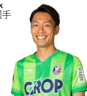
松永成立・著 北健一郎・構成 東邦出版

中学生のときに買った本です。ゴールキーパー(GK)の基本が書いてあります。これを読むとGKのおもしろ味や深みがよりいっそうわかるので、GKをやっている人、特にGKコーチがない人にはおすすめ! サッカーをやっていない方には、年末年始の時間があるときに、これを読んでGKについて考える時間を持てただけだと幸いです(笑)。